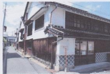
港町の面影が残る家並み