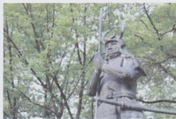
月山富田城跡・山中鹿介像